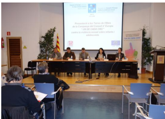
Inauguració a Tortosa

Quant a la Taula Rodona, amb la temàtica habitual de millora i prevenció de l'abús sexual i altres maltractaments, i treball en xarxa, va ser moderada per la