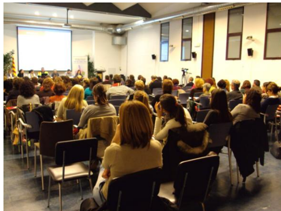
Taula rodona i assistents