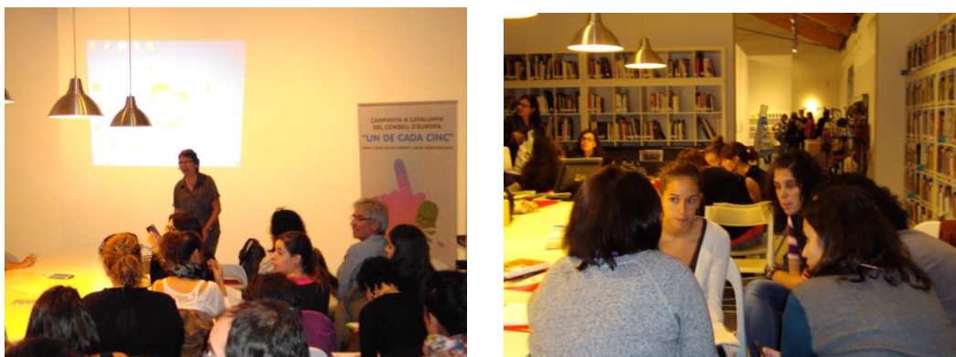
Sessió de treball amb educadors de la Paeria