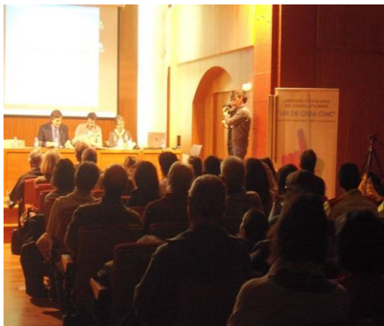
Inauguració a la Capella de la Immaculada