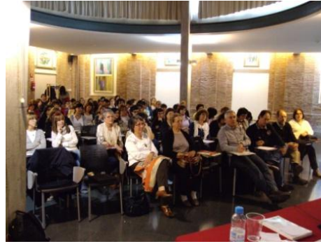
Assistents a la Sala de l'Edifici El Sucre